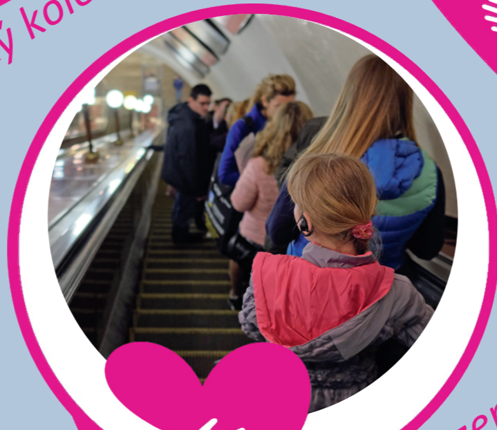
Cestování v tuzemsku