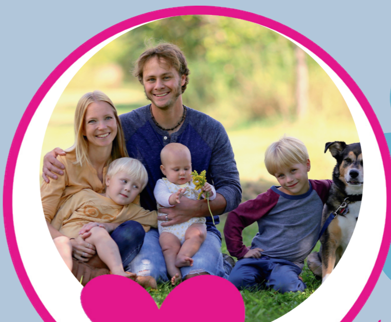
Rodina a přátelé

KAŽDÝ ŮČKOVANÝ ČLOVĚK CHRÁNÍ PŘED NÁKAZOU SEBE. ZÁROVEŇ TĚM, ŽE ZŮSTANE ZDRAVÝ, CHRÁNÍ KAŽDĚHO, S KÝM SE SETKÁ. TO JE PRINCIP KOLEKTIVNÍ IMUNITY. ČÍM VÍCE ŮČKOVANÝCH LIDÍ, TĚM VYŠŠÍ OCHRANA PŘED ŠÍŘENÍM NEBEZPEČNÝCH NAKAŽLIVÝCH NEMOCÍ.