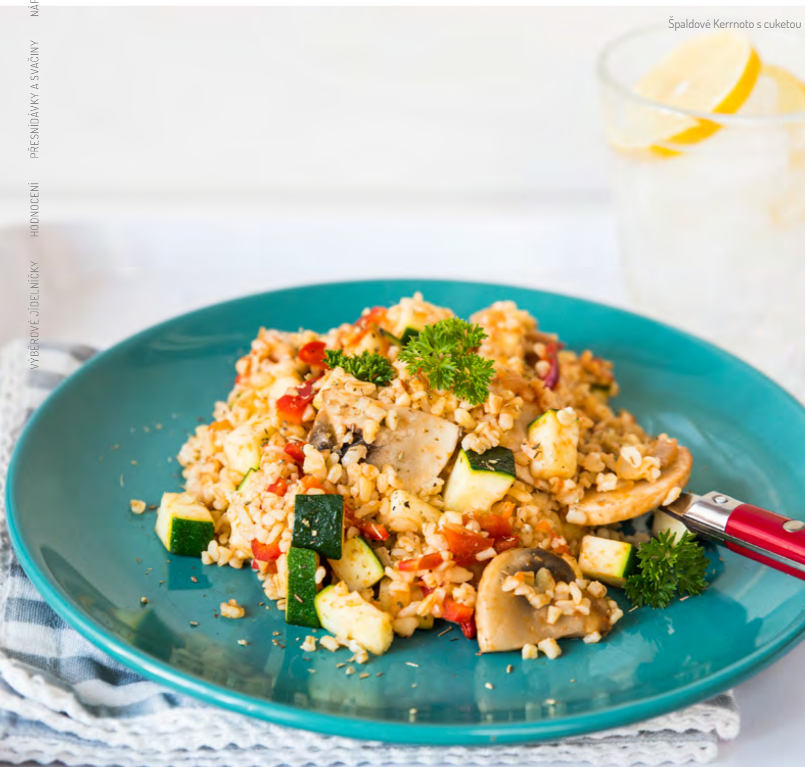
Špaldové Kernoto s cuketou

S ohledem na stále nedostatečnou konzumaci zeleniny dětskou populací, což dokladují i výsledky úkolu vyhlášeného hlavním hygienikem ČR v roce 2011 a 2014 „Monitoring nabídky potravin školním a doplňkovým stravováním pro žáky základních škol“, je nutné této kategorii potravin při sestavování jídelníčků věnovat přednostní pozornost.