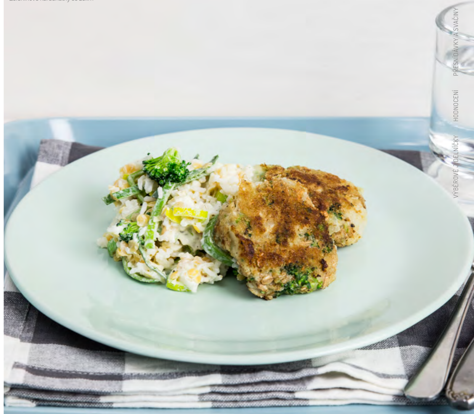
Zeleninové karbanátky se zelím