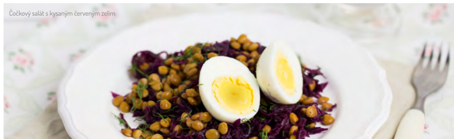
Čočkový salát s kysaným červeným zelím