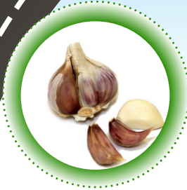
česnek a přírodní dochucovadla