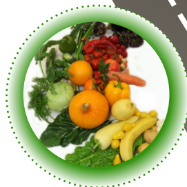
čerstvé ovoce a zelenina