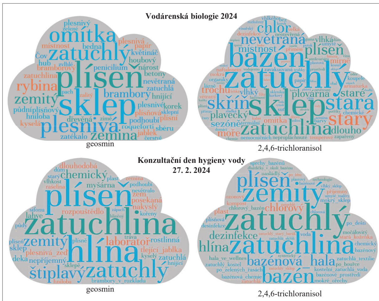
Obr. 2: Slovní popisy (deskriptory) pro vzorky s geosminem a 2,4,6-TCA, které zkoušeli na pach účastníci konference Vodárenská biologie 2024 (N=65) a konzultačního dne hygieny vody SZÚ (N=49). Zobrazeno metodou wordcloud.

nelze o dominantním popisu pachu geosminu nic soudit, protože výsledky z jednotlivých akcí se značně liší. Vcelku logicky je míra vhodných popisů vyšší u pracovníků laboratorních sensorických panelů z výsledků získaných v rámci PZZ (tabulka 2). Ti jednak procházejí odbornou přípravou (kurzy a interními školeními) a také je pro ně (resp. pro jejich laboratoř) důležité, aby v PZZ uspěla, což je vede k tomu se vzorkům v rámci PZZ podrobně věnovat. To, že laboratorní sensorické panely dávají přesnější popisy než další pracovníci vodárenských společností nebo laici, je patrné i z odborné literatury [5].